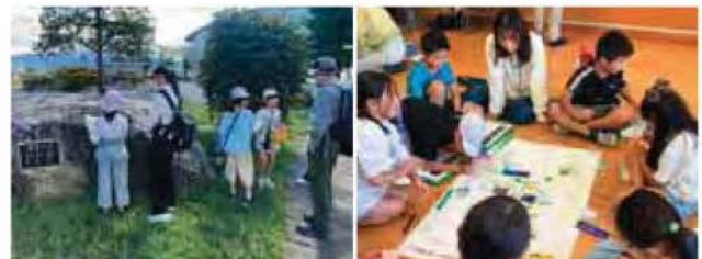
信州大の学生が参加した堀金小での探究学習

主に小中学生を対象にフィールドワークを主体とした探究的な学習講座の運営を行っています。また、2024年からは信州大学や地域住民、安曇野市教育委員会等と連携し運営の協力者の確保・育成、探究活動の普及にも取り組んでいます。