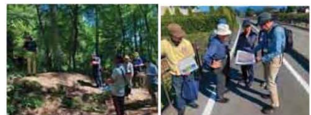
安曇野市内教員向けの研修機会の運営支援