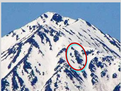
黒い岩肌で「ネガ型」の常念坊が現れる常念岳