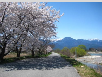
穂高川のほとりに建つ早春賦歌碑。毎年4月29日には「早春賦まつり」が開かれます。作詞者の吉丸が歌に込めた思いは、100年経った現在も、大切に歌い継がれています。

春と聞かねば知らでありしを 聞けば急がる 胸の思いを いかにせよこの頃か いかにせよこの頃か