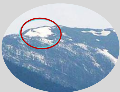
白い残雪で「ポジ型」の蝶が現れる蝶ヶ岳