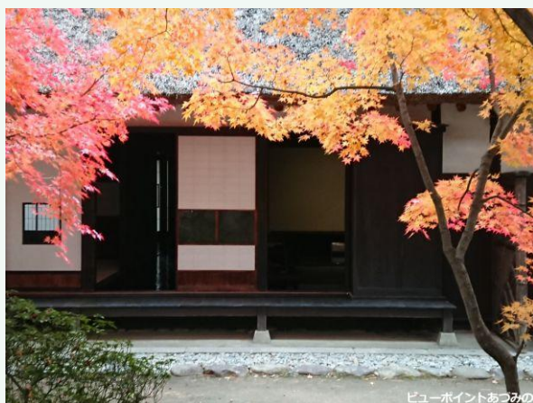
山門の紅葉～安曇野市堀金烏川 重厚感のある大庄屋山口家の山門

風景投稿サイト「ビューポイントあづみの」 http://viewpoint.nagapic.jp/