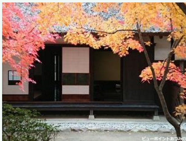
石垣と板塀に沿って～ 大庄屋山口家

風景投稿サイト「ビューポイントあづみの」 http://viewpoint.nagapic.jp/