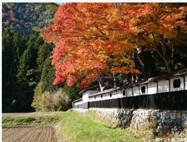
茅葺の彩り ～ 高橋節朗美術館