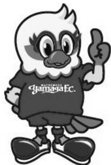
松本山雅FC ガンズくん